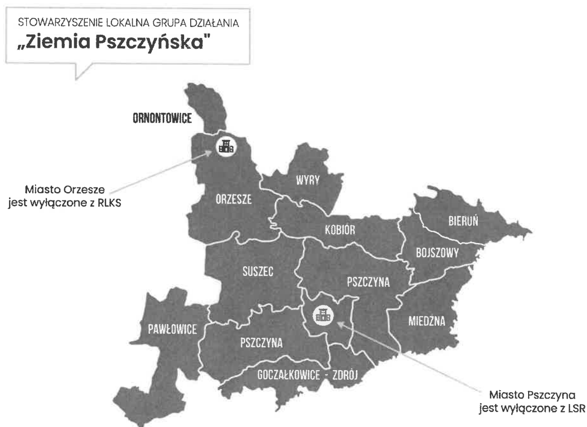
Rysunek 1 Obszar działania LGD