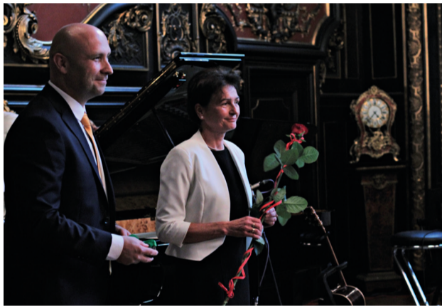
Przywitanie gości i podziękowania

Pomysł utworzenia partnerstwa w formie Lokalnej Grupy Działania zrodził się wśród przedstawicieli lokalnych władz samorządowych gmin Pawłowice i Suszec na początku roku 2008. Po przeprowadzeniu wstępnych rozmów i konsultacji w zakresie możliwego kształtu terytorialnego LGD, ostatecznie zdecydowano o podjęciu próby zainteresowania tematem wszystkich gmin Powiatu Pszczyńskiego i objęciu podejściem LEADER całego jego obszaru. Koordynacją ca-