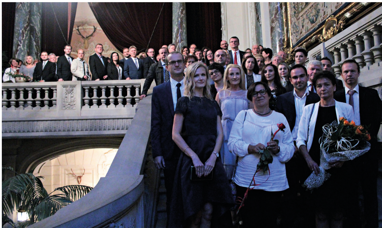
Jubileusz 10-lecia LGD „Ziemia Pszczyńska”

Najważniejszym dla nas wydarzeniem, jakie miało miejsce w drugiej połowie 2018 roku był Jubileusz 10-lecia naszego stowarzyszenia, który odbył się 22 września w Muzeum Zamkowym w Pszczynie. We wrześniu ogłosiliśmy także kolejne nabory wniosków o powierzenie grantu, które odbyły się na przełomie września i października. W październiku LGD „Ziemia Pszczyńska” ponownie przyłączyło się do organizacji obchodów Ogólnopolskiego Tygodnia Kariery, w tym roku odbył się pod hasłem „Bądź architektem swojego szczęścia”. Tak jak w latach poprzednich, w ramach tego przedsięwzię-