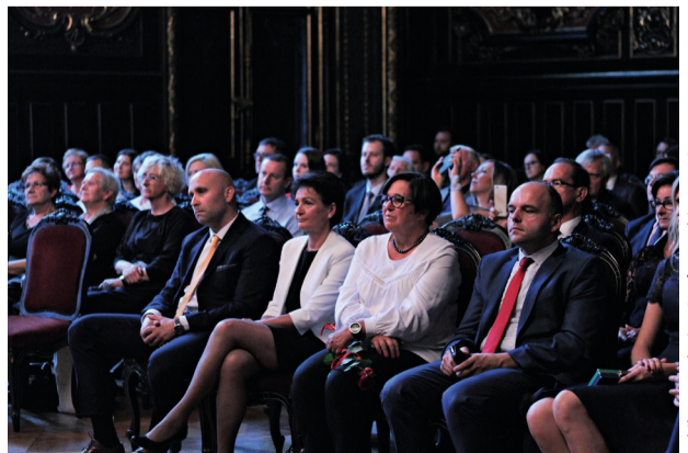
Jubileusz 10-lecia LGD, fot. archiwum LGD

Mamy nadzieję, że nasza działalność jest widoczna w lokalnym środowisku i będziemy starać się, aby środki pozyskane za pośrednictwem LGD jak najpełniej odpowiadały na potrzeby naszych mieszkańców.