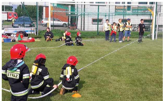
Zawody pożarnicze

Z przyjemnością informujemy, że w wyniku powierzenia grantów w naborze 3/2018, jest organizowanych wiele wydarzeń na obszarze działania LGD „Ziemia Pszczyńska”. Sporo działań jeszcze przed nami, nie mniej jednak informujemy o projektach, które zostały zrealizowane do czasu wydania tego numeru biuletynu.