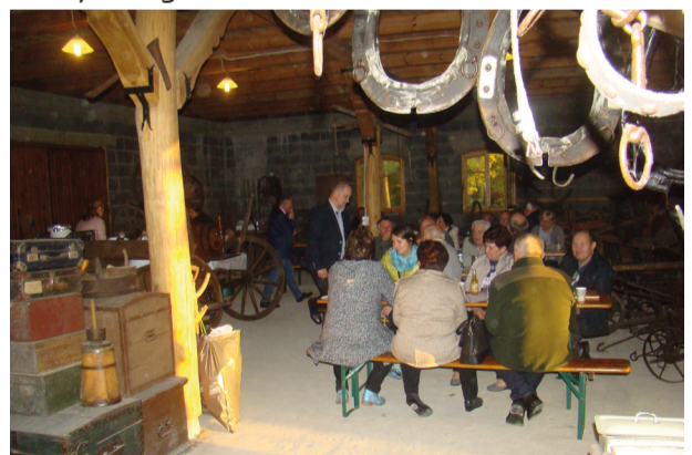
Stowarzyszenie Pszczelarzy Ziemi Pszczyńskiej

W ramach zadania pt. „Społeczność siłą rozwoju - integracja społeczna mieszkańców sołectwa Jankowice” odbył się cykl szkoleń podnoszących wiedzę z zakresu pożarnictwa. Przeprowadzono także zawody sportowo-pożarnicze, podczas których uczestnicy mieli za zadanie wykorzystać wiedzę zdobytą podczas szkoleń. Na zakończenie podsumowano projekt i wręczono nagrody oraz dyplomy. W ramach zadania zakupiono również opaski odblaskowe i kamizelki, które rozdano mieszkańcom. Całe wydarzenie zostało zwieńczone spotkaniem integracyjnym, uświetnionym występem zespołu muzycznego.